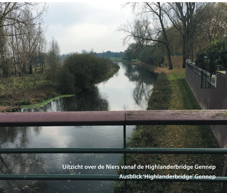
Uitzicht over de Niers vanaf de Highlanderbridge Gennepe Ausblick 'Highlanderbridge' Gennepe

Het enige museum ter wereld waar je dwars doorheen kunt fietsen. Maak van dicht bij mee voor welke dilemma's gewone mensen komen te staan in oorlogstijd. Bekijk hoe vanuit verschillende invalshoeken WO II ingreep in het leven van de bevolking. Krijg uitleg bij de enige tankslag in Nederland, de slag om Overloon.