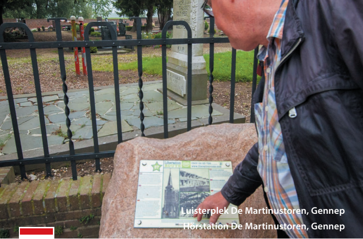
Luisterplek De Martinustoren, Gennepe Hörstation De Martinustoren, Gennepe