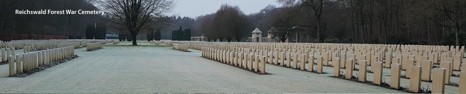
Reichswald Forest War Cemetery

In samenwerking met de gemeenten Land van Cuijk, Uedem en Weeze zijn zes grensoverschrijdende fietsroutes ontwikkeld. In samenwerking met den Gemeinden Bergen, Gennep, Goch, Kalkar, Land van Cuijk, Uedem und Weeze wurden sechs grenzüberschreitende Fahrradrouten entwickelt. www.visitoordlimburg.nl/fietsenovergrenzen