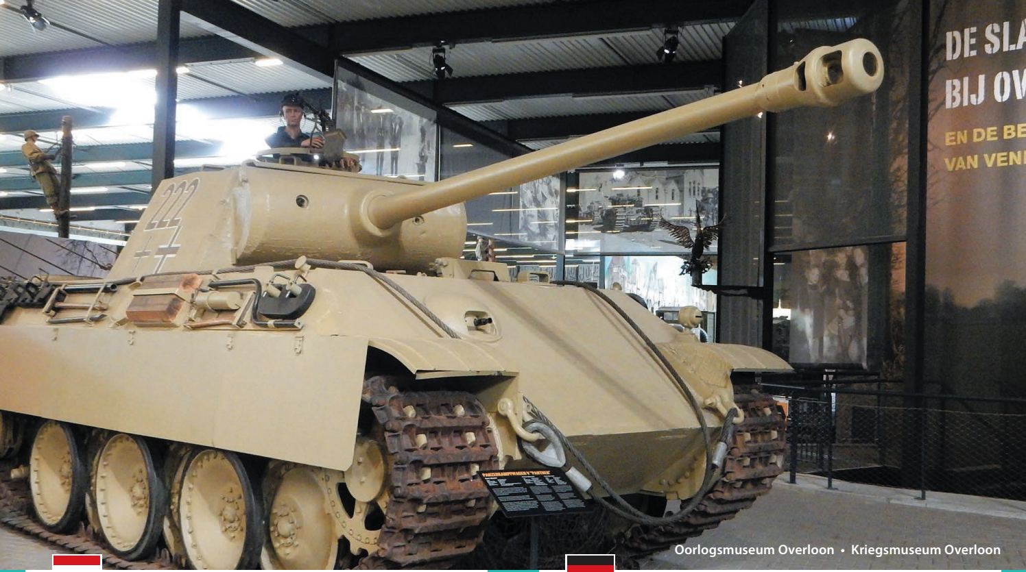
Oorlogsmuseum Overloon • Kriegsmuseum Overloon

Zo'n 75 jaar na de beëindiging van WOII voert de Remembranceroute langs het oorlogsverleden van het grensgebied Land van Cuijk, Maasduinen en Niederrhein. Tijdens deze periode hebben de levenspaden van mensen uit Nederland en Duitsland elkaar gekruist en voor altijd ingrijpend veranderd. Over de grenzen heen verbindt deze route ons met elkaar, toen en nu.