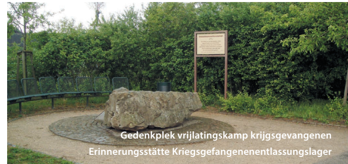
Gedenkplek vrijlatingskamp krijgsgevangenen Erinnerungsstätte Kriegsgefangenenentlassungslager

rotes Kreuz auf dem Dach vor den alliierten Bombern geschützt - der völligen Zerstörung im Zweiten Weltkrieg. Zwischen Knp 40 und 42.