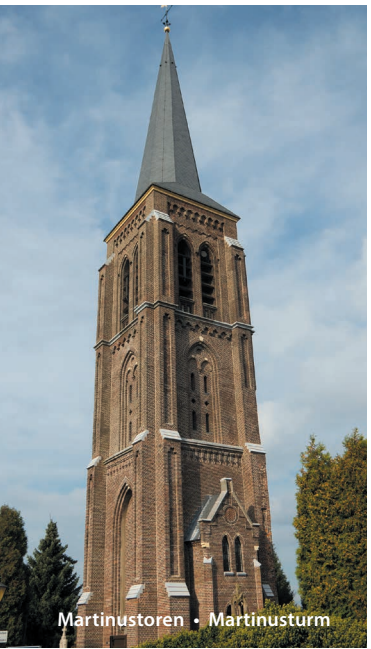
Martinustoren • Martinusturm

Onderweg zijn overal gezellige terrasjes waar je kunt genieten van verse streekgerechten. Of zoek jouw eigen picknickplek aan de Maas! Langs de route kom je mooie kapelletjes, kunstwerken en ander bezienswaardigheden tegen. En vergeet niet verse streekproducten voor thuis te kopen in een van de leuke streekwinkeltjes langs de route.