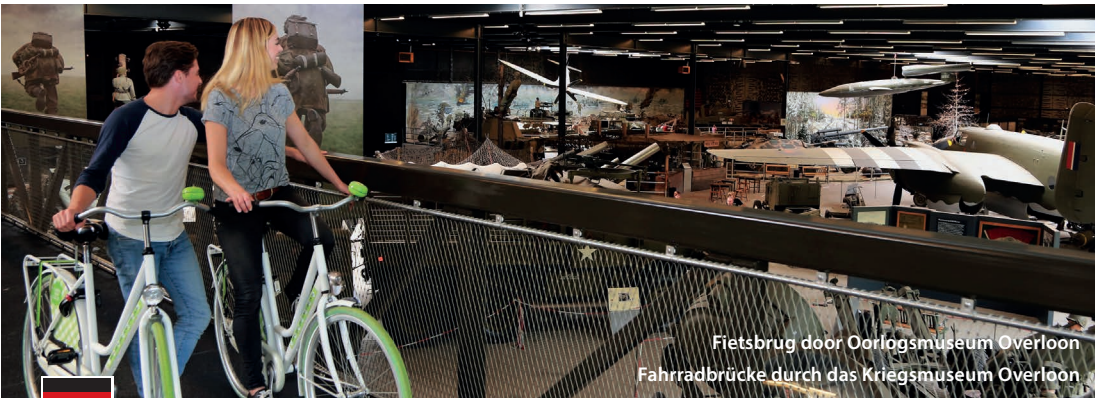
Fietsbrug door Oorlogsmuseum Overloon Fahrradbrücke durch das Kriegsmuseum Overloon

Het eerste en enige Royal Air Force Museum in Duitsland nodigt u uit voor een tijdreis door de 45-jarige geschiedenis van de Royal Air Force