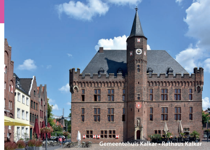
Gemeentehuis Kalkar • Rathaus Kalkar

Dank seiner strategischen Lage war Well jahrhundertlang eine zentrale Handelsstelle. In dem an der Maas gelegenen Donjon mit Wohnturm wohnte der Schlossherr. Die freie Herrschaft Well (mit großen eigenen Befugnissen) entstand im 11. Jahrhundert, als die zentrale Verwaltung des Gebietes Niedermaas und Rhein weggefallen war und der Schloherr selbst die Verwaltung übernahm. Zu dieser Herrschaft gehörten Well, Wellerloo, Ayen,