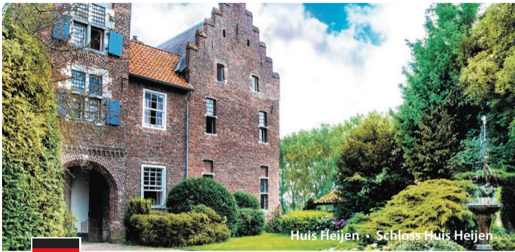
Huis Heijen • Schloss Huis Heijen