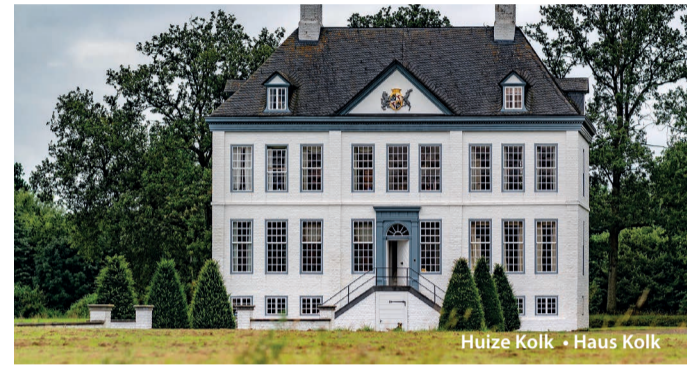
Huize Kolk • Haus Kolk

Bergen (bis nach Heukelom) und an der anderen Seite der Maas ein Teil von Wanssum.