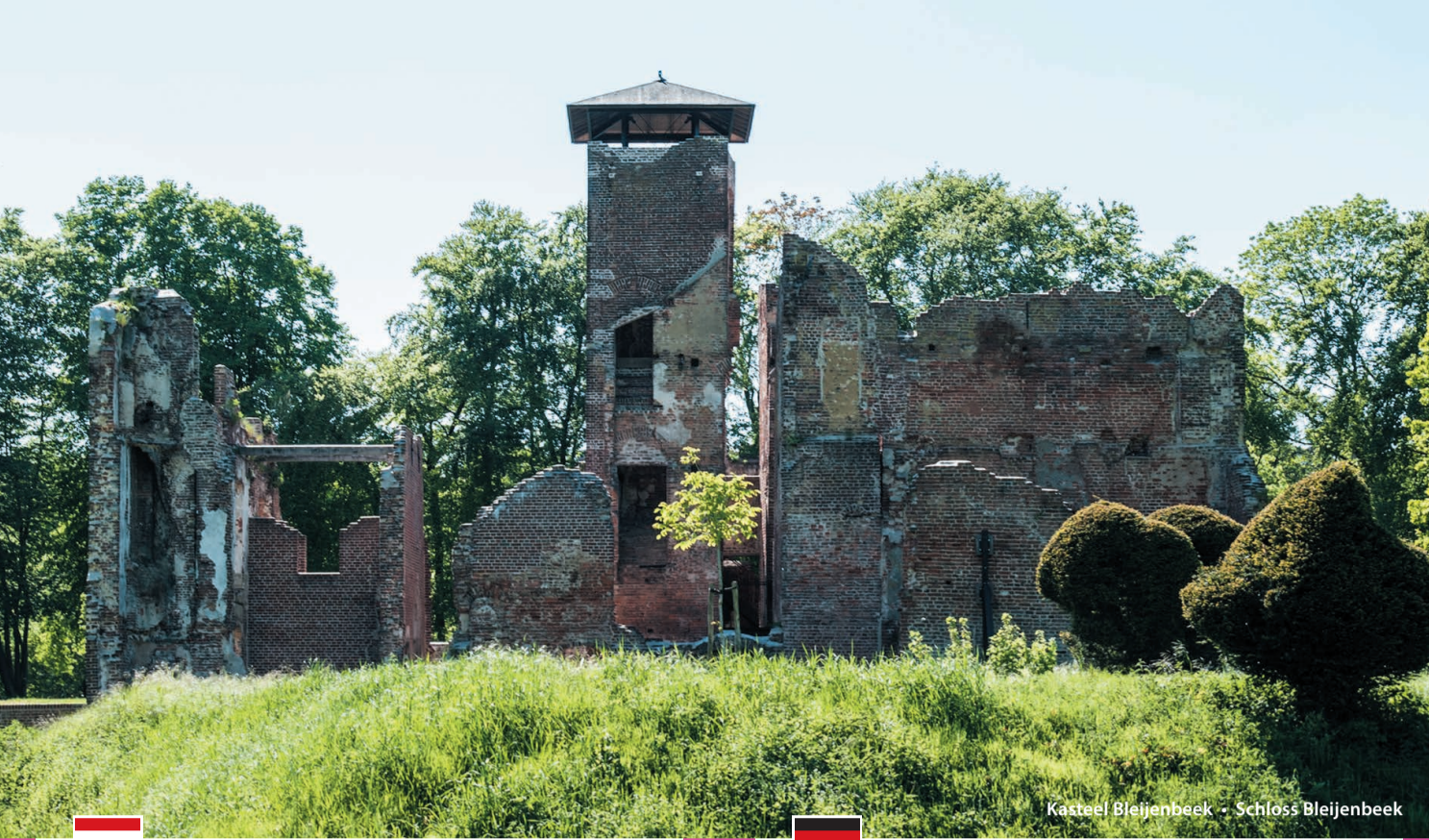
Kasteel Bleijenbeek · Schloss Bleijenbeek