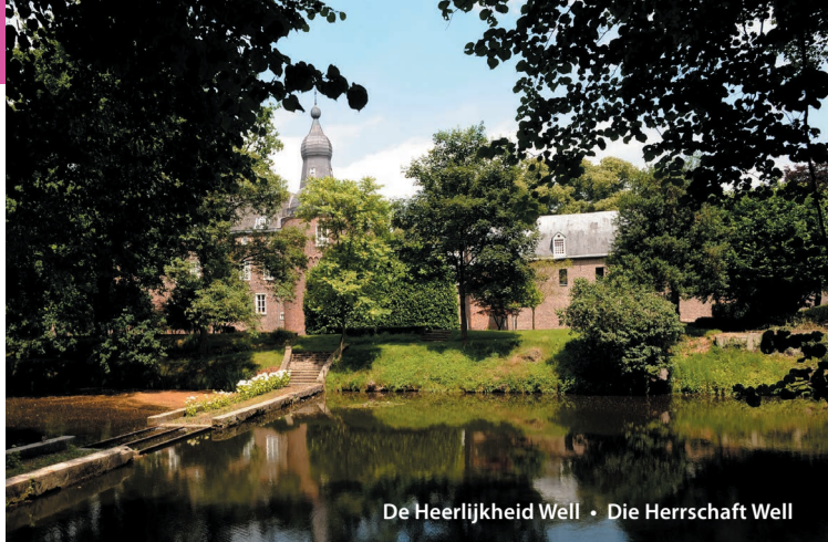
De Heerlijkheid Well • Die Herrschaft Well