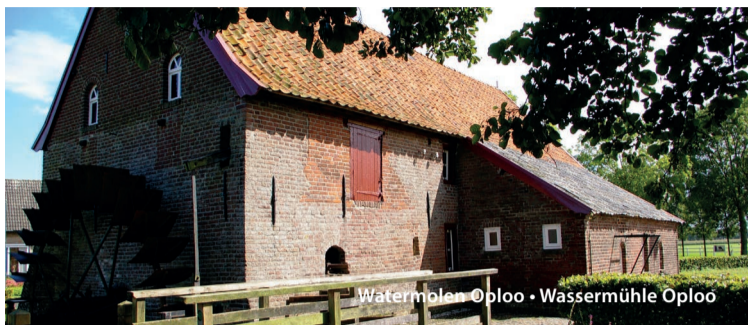
Wassermühle Oploo • Wassermühle Oploo