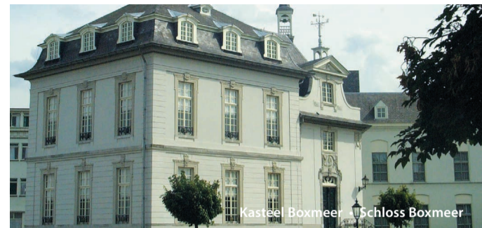
Kasteel Boxmeer • Schloss Boxmeer