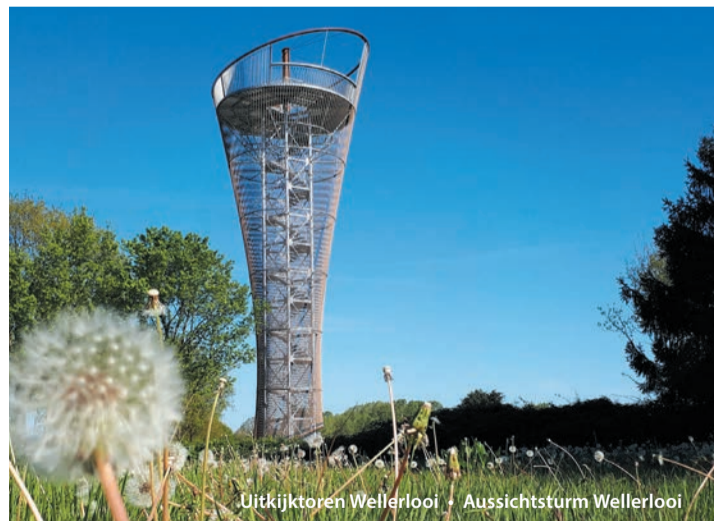
Uitzijktoren Wellerlooi • Aussichtsturm Wellerlooi

In Wellerlooi an der Maas befindet sich ein futuristisch anmutender Aussichtsturm. Zum Eintritt von nur 1 Euro darf man ihn besteigen. Die Aussicht ist einfach unbeschreiblich. Vom höchsten Punkt aus kann man sehr weit den Verlauf der Maas sehen und sowohl bis zur Provinz Brabant, als auch nach Deutschland schauen.