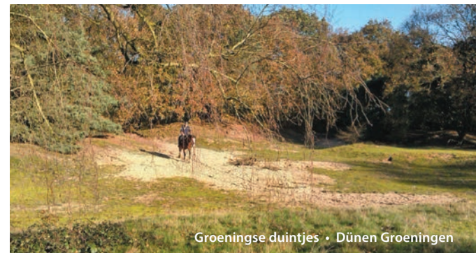
Groeningse duintjes • Dünen Groeningen