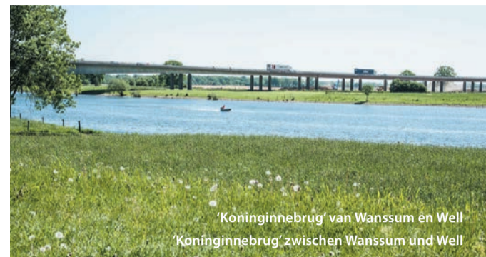
'Koninginnebrug' van Wanssum en Well 'Koninginnebrug' zwischen Wanssum en Well