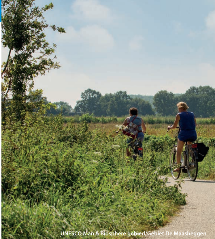
UNESCO Man & Biosphere gebied/Gebiet De Maasheggen

Een natuurgebied waar u naast fotogenieke stuifduinen ook heide en geurige naaldbossen vindt.