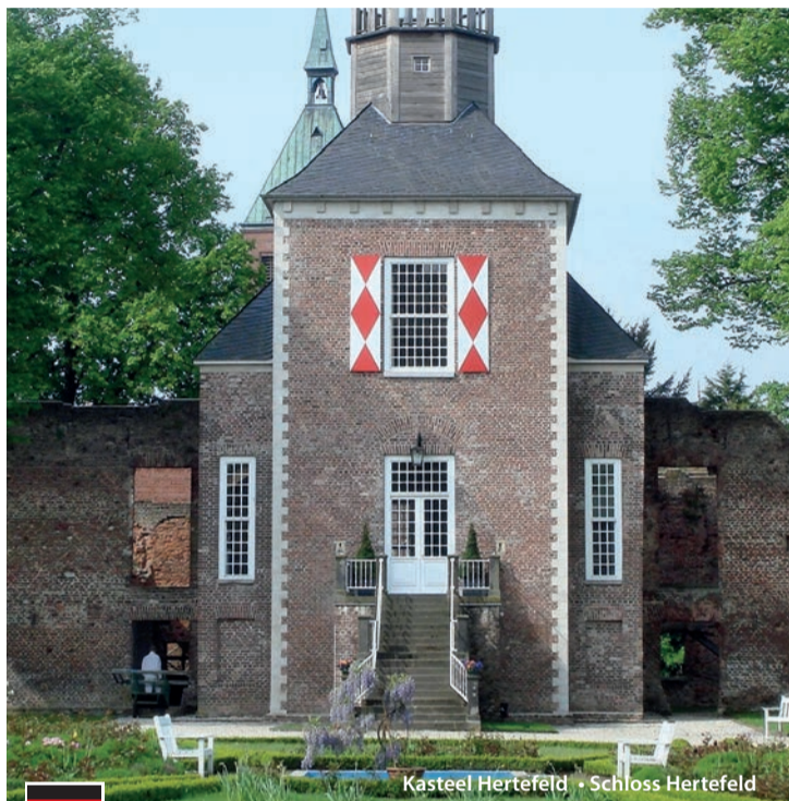
Kasteel Hertefeld • Schloss Hertefeld

Het historische monument ligt in Weeze aan de Nederrijn verscholen achter oude bomen in een prachtig groot opgezet kasteelpark. Kasteel Hertefeld is 'Duitslands enige bewoonbare kasteelruïne' en is daardoor een beleving op zich.