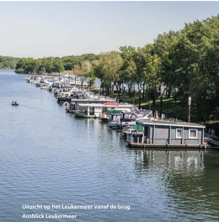
Uitzicht op het Leukermeer vanaf de brug Ausblick Leukermeer